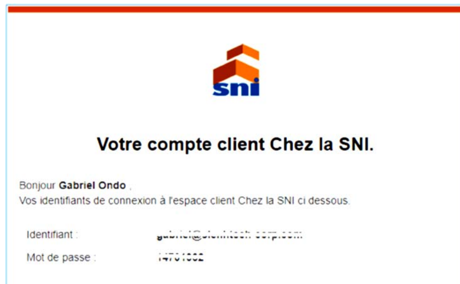
Figure 2 : Mail de notification de création de compte

Pour la première demande, un compte client est automatiquement créé dont les informations, email et mot de passe , sont envoyés à l'adresse mail ( voir figure 2 ) fourni par le client ( ceci pour vérifier la validité de l'email fourni par l'utilisateur ).